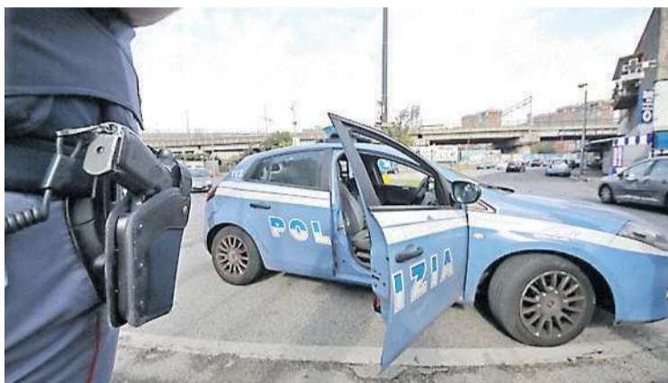
La polizia ha individuato due studenti-terroristi napoletani