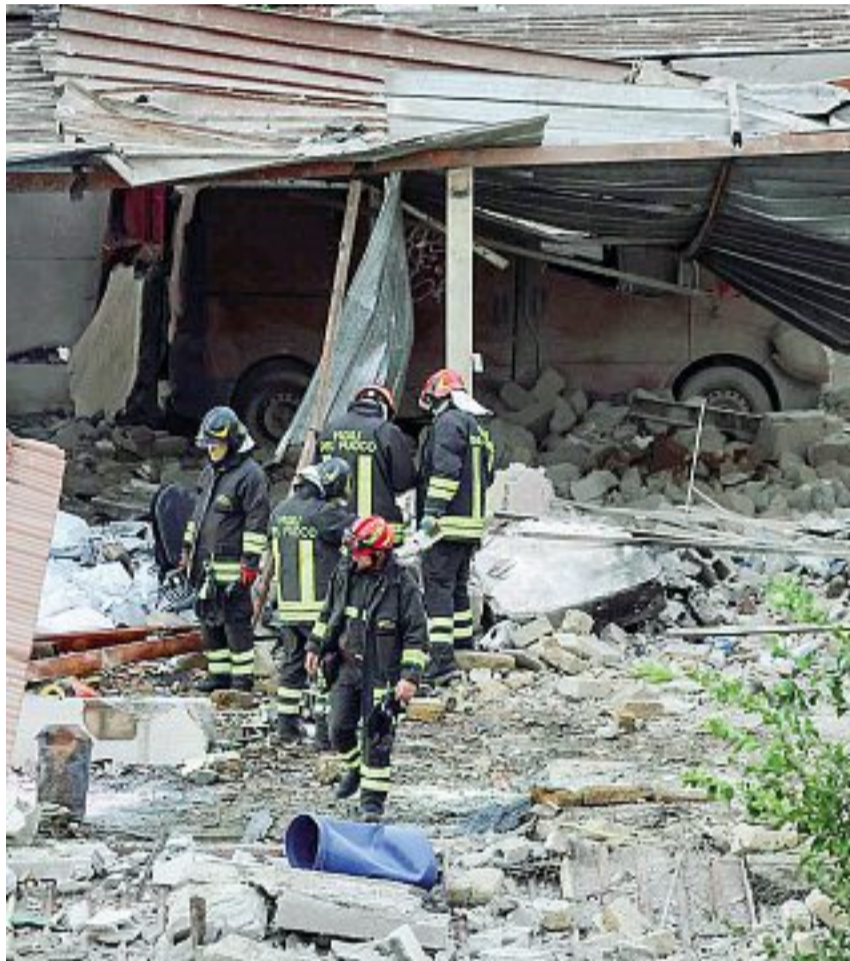
Come in guerra L'area devastata dall'esplosione, danneggiate alcune abitazioni

Ercolano Il laboratorio abusivo di fuochi artificiali era già stato segnalato ai vigili urbani. I testimoni: temevamo fosse il Vesuvio