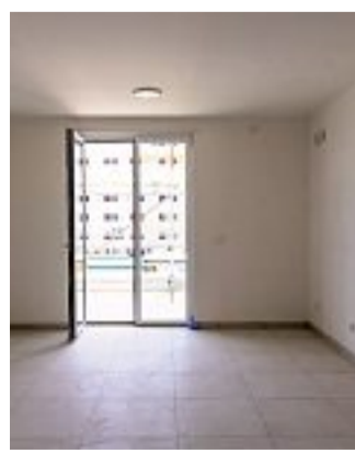
Il progetto «ReStart» A sinistra, le nuove palazzine che stanno sorgendo a Scampia. Sopra, gli interni