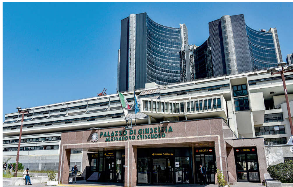
◀ Nella foto a sinistra il Tribunale di Napoli al Centro direzionale