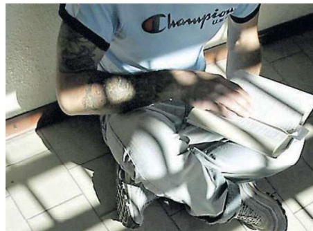
Il carcere di secondigliano, per F.G., è ormai alle spalle